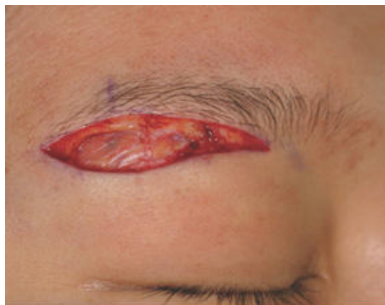
Hình 2. Xem sau cắt bỏ da đường dưới cung mày. 2/3 ngoài đảo da hình elip, mặt phẳng của vết mổ phải vừa đủ sâu đến phần ổ mắt của cơ vòng mi.

Trong 3 năm qua, chúng tôi đã thực hiện 128 ca phẫu thuật cắt bỏ qua đường dưới cung mày ở 64 bệnh nhân nữ. Bệnh nhân có độ tuổi từ 32 đến 61 tuổi. Thời gian theo dõi là 6 tháng đến 2 năm, trung bình là 13 tháng. Thời gian mổ trung bình là 35 phút. Tất cả bệnh nhân đều hài lòng với kết quả và không có biến chứng nào được ghi nhận liên quan đến các bất thường về cảm giác và sẹo có thể nhìn thấy được. Khi được hỏi về kết quả sau phẫu thuật và sự thoải mái, bệnh nhân cho biết đã cải thiện thị giác, cảm giác nhẹ hơn ở mi mắt ngoài, cải thiện độ chùng da từ nếp mí ở phía ngoài và chắc chắn và trả lại nếp mí mắt lúc trẻ. Bệnh nhân đã được thông báo trước phẫu thuật về khả năng lông mày nằm ngang, có thể cần tạo hình xăm cung mày trong một số trường hợp. Điều thú vị là không có bệnh nhân nào phản nản hoặc lo lắng hoặc nhận thức được bất kỳ sự thay đổi nào về vị trí hoặc hình dạng cung mày.