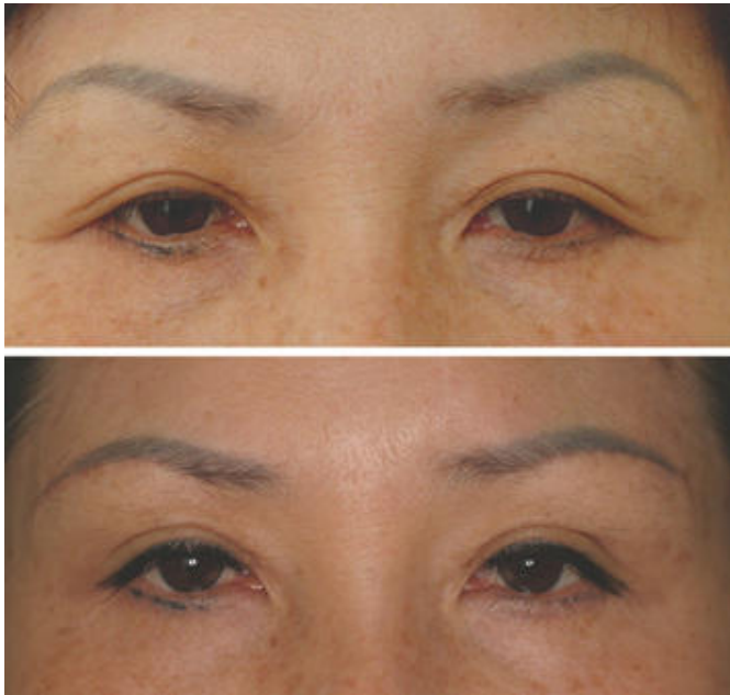
Hình. 3. Trường hợp 1, một bệnh nhân 50 tuổi với mí mắt bị lão hóa. (Ảnh trên) Hình ảnh trước khi phẫu thuật cho thấy mí mắt ngoài. Bệnh nhân phàn nàn về tình trạng khó chịu ở mí mắt ngoài và một số da thừa góc mắt ngoài. 6 tháng sau phẫu thuật cho thấy đã cải thiện tình trạng thừa da và da phủ lên nếp mí

được cắt bỏ trong một đường cắt dưới cung mày (Hình 3).